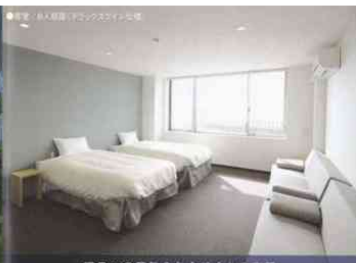
明日への英気を与えてくれる空間。