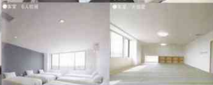
サッカーで疲れた身体を癒してくれる空間。