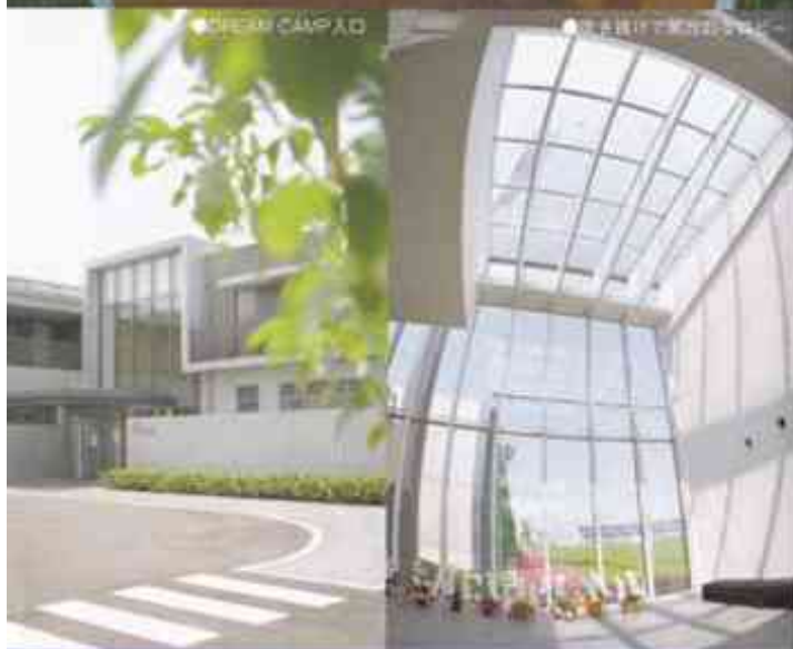
迎え入れた人達の夢を掻き立てる空間。